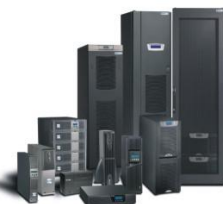
Решение на основе источника бесперебойного питания (ИБП)