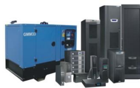
Решение на основе совместного использования ИБП и ДГУ