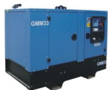
Решение на основе дизель-генераторной установки (ДГУ)