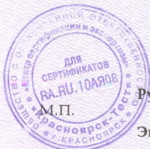
Схема сертификации 2.

Протокол проверки результата услуг от 13.12.2016 № 5468